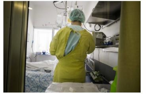
Projeto é liderado pela Universidade do Minho | SA GUARDIENCO

SAUDE Como é sentir medo? Videojogo ajuda estudantes de Enfermagem a lidar com emoções Projeto liderado pela Universidade do Minho e que envolve cinco países criou videojogo em formato escape room para promover competências emocionais dos profissionais de saúde. Natália Faria 6 de Novembro de 2022, 7:17 Receber alertas