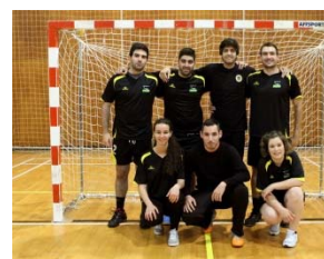
Bronze em Andebol (coletiva)

A Equipa de Andebol agradece a todos intervenientes que lutaram e apoiaram para que este resultado fosse possível, enaltecendo o curso de Enfermagem perante toda Universidade do Minho.