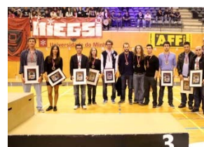
Bronze em Ténis de Mesa (individual)